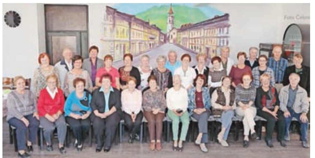
Fotografija za spomin

Tržič – Bil je petek, trinajstega oktobra, ko smo se v restavraciji Raj na srečanju zbrali sošolci in prijatelji letnika 1942. V prijetnem vzdušju in dobri postrežbi smo preživeli nekaj nadvse prijetnih uric ob spominih na mlada leta. Na koncu smo sklenili, da bo vnaprej srečanje vsako leto na prvi petek v oktobru ob 17. uri, zato že sedaj vabimo tudi tiste, ki se iz ga kakršnegakoli razloga tokrat niso mogli udeležiti, da se nam drugo leto pridružijo.