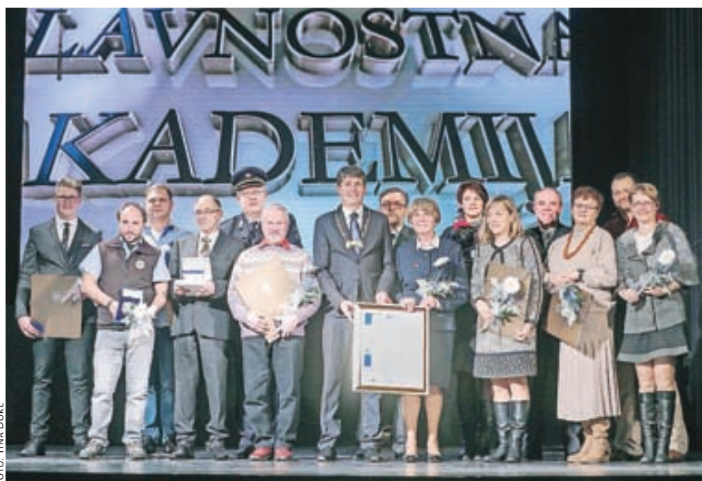
Letošnji nagrajenci z županom Borutom Sajovicem in častno občanko Jožefo Koder.

izposoja drsalk. Drsališče je odprto od ponedeljka do petka od 16. ure do 19.30, ob sobotah od 10. do 12. ure in od 16. ure do 19.30, za odrasle pa tudi od 19.30 do 21. ure. Ob nedeljah in med prazniki lahko drsate od 10. do 12. ure in od 15. do 19. ure. Hokej lahko igrate po dogovoru v večernih urah – od 20. ure do 21.30. Drsališče bo predvidoma odprto do sredine januarja 2018.