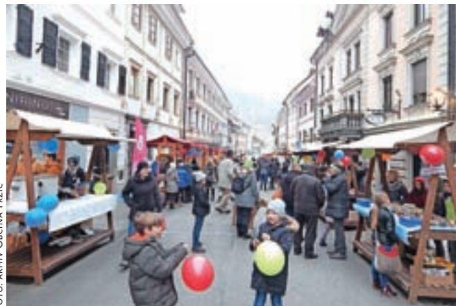
Posnetek je iz lanskega Novoletnega bazarja, na katerega vabijo tudi letos, 19. decembra, od 16. ure dalje.