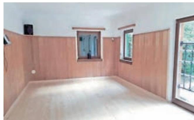
Planinski dom pod Storžičem z urejenim prostorom za učno sobo

kolesarska doživetja. V Planinskem domu pod Storžičem smo uredili kolesarnico s pralnim platojem in učno sobo, v Domu na Kofcah kolesarje čaka nova kolesarnica, v Planinskem domu na Zelenici pa smo uredili prostora za pralnico in dodatna ležišča, ki bodo zaživelja že to zimo. V drugem obdobju, ki traja do 30. aprila 2018, bomo prostore opremili do te mere, da bodo kar najbolj ustrezni za kolesarska, pohodniška in zimska doživetja. Po novem nas lahko spremljate tudi na Facebook strani Alpe Adria Karavanke / Karawanken, kjer vas bomo redno informirali o območju ter projektnih aktivnostih in rezultatih.