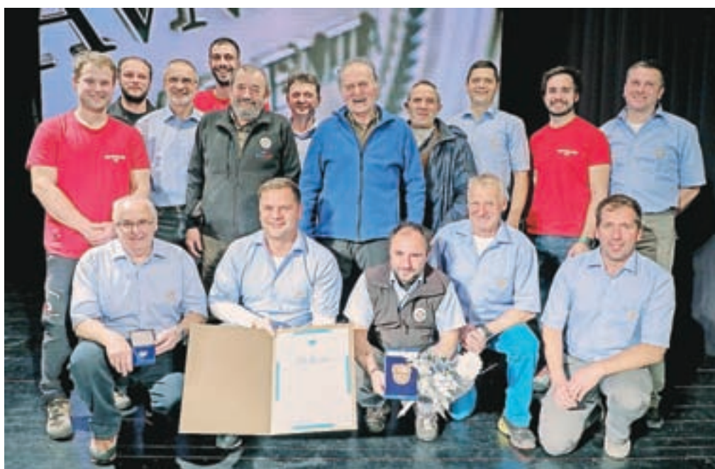
Del članstva Društva Gorska reševalna služba Tržič

prejela Župnijska karitas Križe, ki vse od svoje ustanovitve leta 2000 kontinuirano lajša socialne stiske krajanov in mehanizme župnije Križe, izjemoma občanov iz drugih delov občine. Najpomembnejše dejavnosti prostovoljcev, trenutno jih je 24, so strnjene okrog medgeneracijskega sodelovanja in vključevanja starejših, bolnih in invalidnih, animiranja otrok in mladine ter razdeljevanja socialne pomoči. Zelo odmeven je tradicionalni dobrotelni koncert na nedeljo Karitas, v zadnjih letih pa se je Župnijska karitas Križe izkazala tudi kot koordinatorica človekoljubnih dogodkov s sodelovanjem večjega števila ponudnikov pomoči.