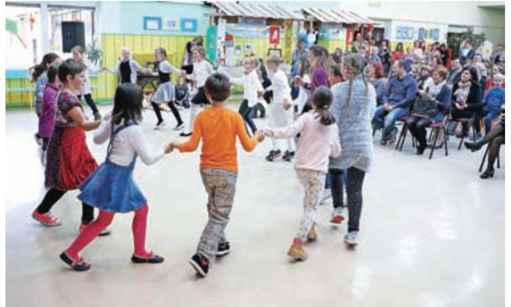
Zaplesali so tudi grški sirtaki.

Križe – Učenci in učitelji iz Osnovne šole Križe živijo slogan Drugačnost bogati. V zadnjih treh letih so bili povezani z devetimi šolami iz Nemčije, Velike Britanije, Nizozemske, Finske, Grčije, Romunije, Poljske, Italije, Španije. Učenci partnerskih držav v projektu Erasmus+ so drug drugemu predstavljali kulturo, jezik, znamenitosti svojih držav. Spoznava-li so arhitekturo držav, gradili makete slavnih stavb, proučevali zgodovinske dogodke in junake iz preteklosti. Prebirali so ljudske pripovedke in ustvarjali lutkovne predstave, peli znane pesmi in plesali tradicionalne plesne. Del teh novih spoznanj in znanj so delili na jesenski zaključni prireditvi za starše, prijatelje, tržiškega župana, podžupana in druge predstavnike lokalne skupnosti, ki so jih na panojih pozdravile sončnice drugošolcev, ki so stopili v čevlje nizozemskega slikarja Van Gogha. Otroški pevski zbor je zapel pesem iz priljubljene poljske risanke o medvedku Uhačku, mladins-