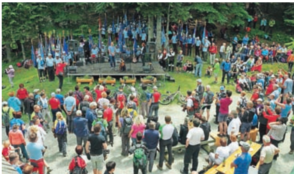
Dan slovenskih planinskih doživetij – Pod Storžič 2017

Prav tako smo v Domu pod Storžičem že drugo leto gos-