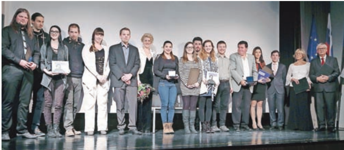
Prejemniki letošnjih Kurnikovih plaket v družbi voditeljev svečane podelitve na odru Kulturnega centra